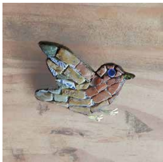
Mosaic Bird brooch -red