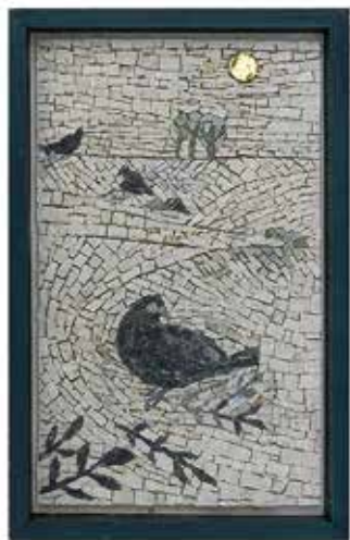
Mosaic Pigeons 02