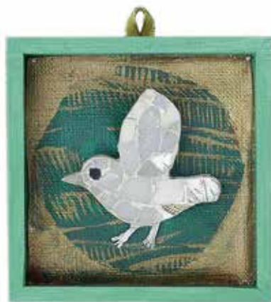
Mosaic Bird brooch 02