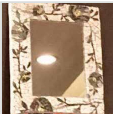
モザイクミラー椿 No.11