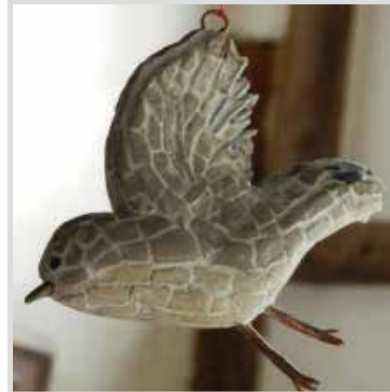
Very Happy Bird No.20