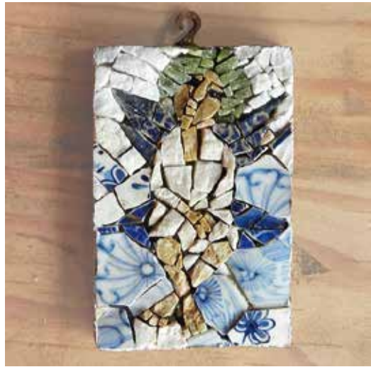
Mosaic Ikon 休息