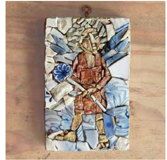
Mosaic Ikon 戦士