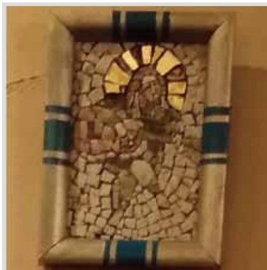
楽 士 No.16