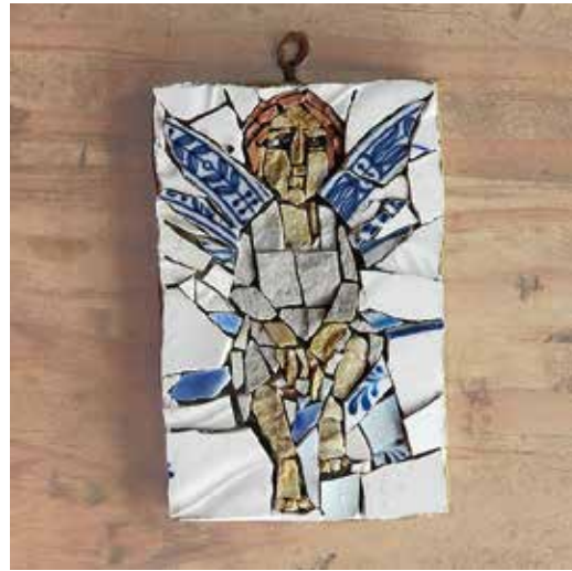
Mosaic Ikon 千里眼