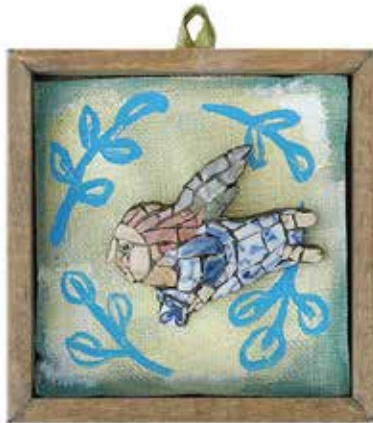
Mosaic Ikon brooch