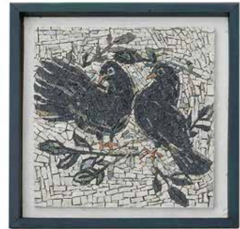
Mosaic Pigeons 01