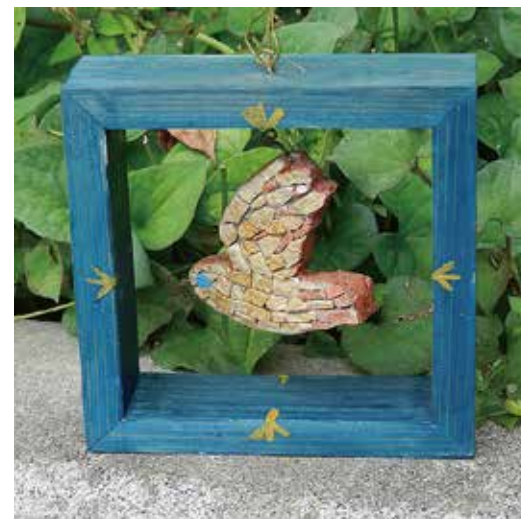
Mosaic Bird objet